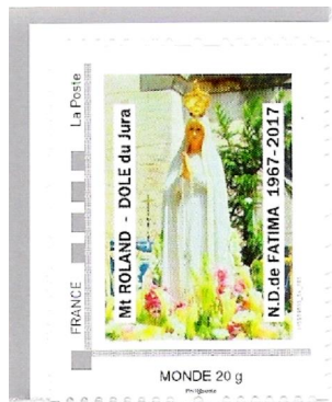
Timbre de feuille 20 g MONDE