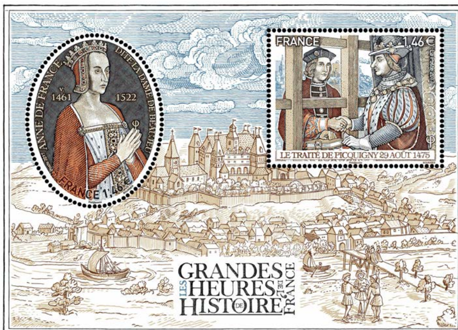
Visuel d'après maquette/ disponible sur demande

Le 3 juillet 2017, La Poste émet le sixième bloc de la série les Grandes Heures de L'Histoire de France.